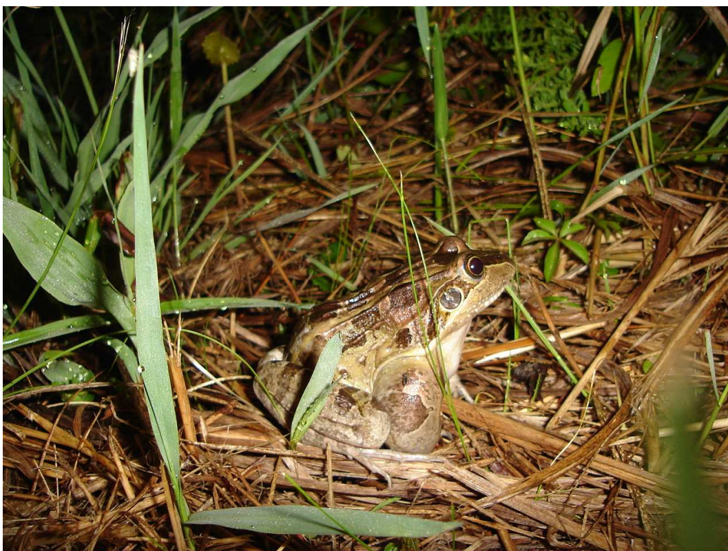
Figura 1. Macho de Leptodactylus latrans (braço mais desenvolvido, devido ao dimorfismo sexual).