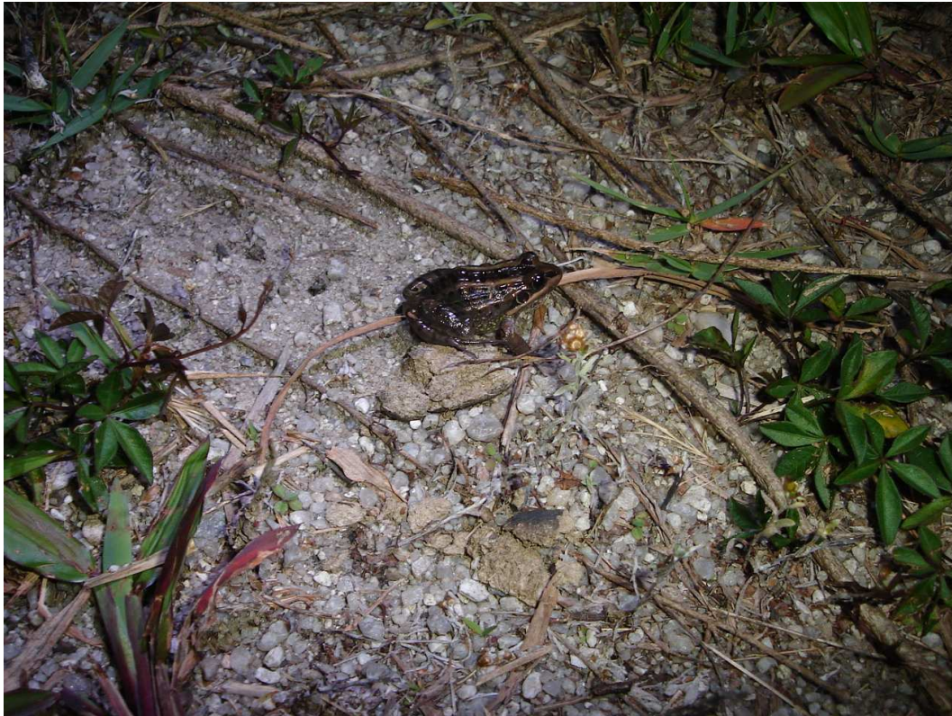
Figura 3. Juvenil de rã-manteiga L. latrans diferencia-se do adulto pelo tamanho corporal.

A reprodução ocorre de setembro a fevereiro, sendo os ovos depositados em grandes massas brancas espumosas, circulares, que podem ultrapassar 1000 ovos/postura. Os girinos são gregários e se alimentam de fitoplâncton (Loebmann, 2005; Achaval e Olmos 2007). Alguns peptídeos secretados por esta espécie, através da pele, apresentaram efeito antimicrobiano sobre a bactéria Escherichia coli , podendo ser úteis nas pesquisas biológicas (Nascimento et al. , 2004).