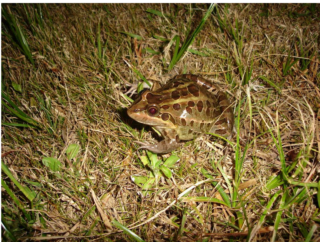
Figura 2. Fêmea de L. latrans .